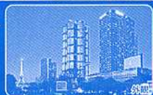
ノボテルトゥールエッフェル(利用ホテル一例)

※利用ホテルは上記又は同等クラスのホテルになります。最終決定ホテルは、確定書面(しおり)にてご案内します。