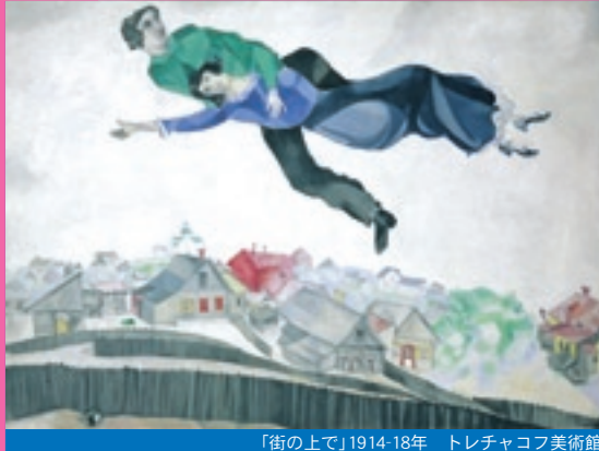
「街の上で」1914-18年 トレチャコフ美術館

ご希望の方はハガキで東兄弟印刷所迄応募ください。応募多数の場合は抽選により、チケットの発送をもって発表とします。7月10日締切。