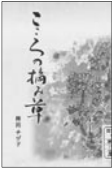
○こころの摘み草 稗田チヅ子著