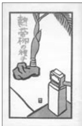
私の稀覯本ノート その11

これは世につたえておきたい かたっておきたい わが胸の底から真実のおもい 人生幾山河のめぐりあい あの日の風やひかり そして空のひとひら 哀歓のかがり火に生きた幾年月の路 「自分史図書館」はその証言館です。