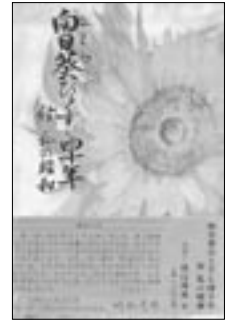
○向日葵ひとすじ四十年