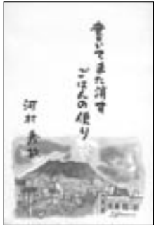
○書いてまた消す ごはんの便り